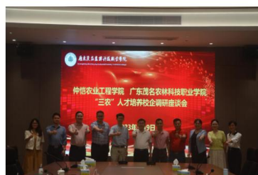
（上图：“三农”人才培养调研座谈会现场）