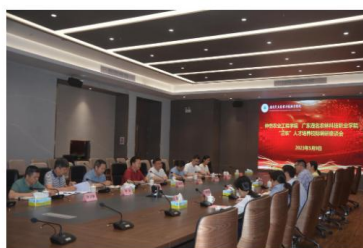
（上图：“三农”人才培养调研座谈会现场）

在“三农”人才培养调研座谈会上，双方就“进一步强化专业建设，突出‘三农’人才培养特色，切实提高人才培养质量”进行专题调研和充分交流。学院组织人事部、继续教育学院、学生工作部、实训中心、教务部负责人、业务骨干及7位仲恺农业工程学院校友企业家参加座谈。