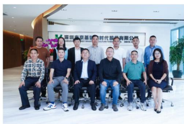
(上图：校企代表合影)