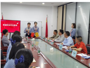
(农林学院-广东德本会计师事务所校企合作洽谈会)