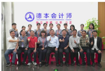
(上图：学校领导与企业领导、实习就业学生代表合影)