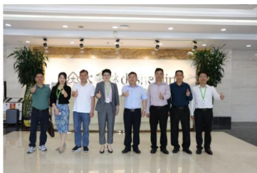
(上图：校企代表合影)

高质量人才是学校与企业协同培养和共同努力的目标，是促进人才培养供给侧和产业需求侧的全方位融合。此次访企拓岗促就业活动，为广东茂名农林科技职业学院与企业构建产学研紧密结合的人才培养模式、实现校企资源有机结合、协同育人创造了良好开端。