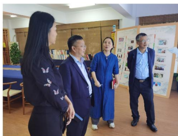
(上图：参观诗经基地)

他山之石，可以攻玉。林里泉院长强调，学院各系，特别是智能工程系，要把本次交流作为序幕，纵深推进两校院系间的交流合作。充分发挥特色优势，创新人才培养模式，推动学院各专业高质量发展。