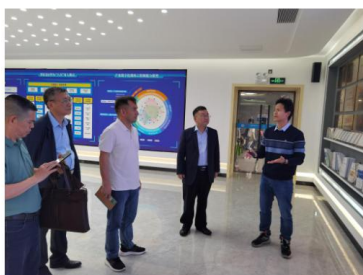
(上图：参观华为ICT国际人才交流中心)