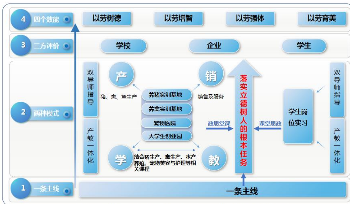
图2 畜牧兽医专业群“1234”一体化课堂革命模式图

“一条主线”：坚持以党建引领、落实立德树人的根本任务为主线，把社会主义核心价值观体系融入职业教育全过程，实施课堂思政。